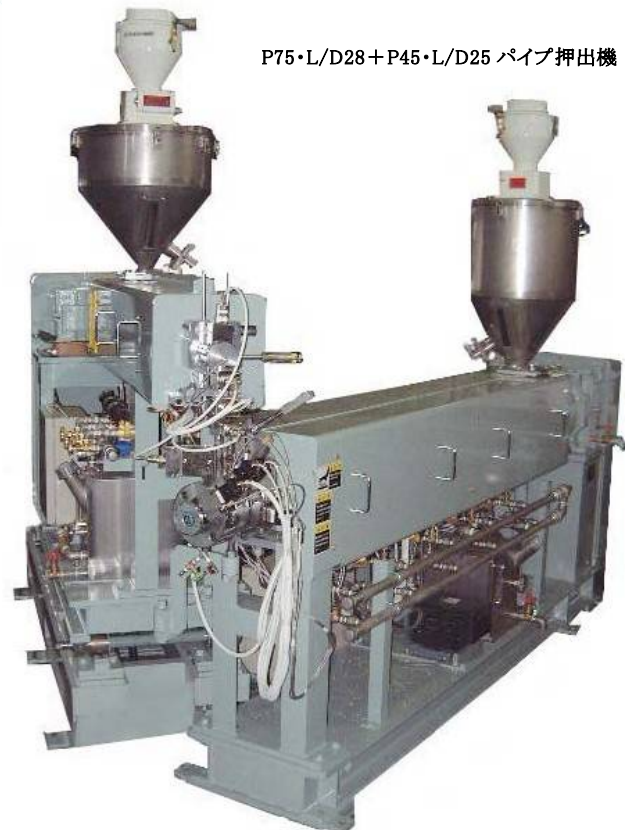
P75・L/D28 + P45・L/D25 パイプ押出機